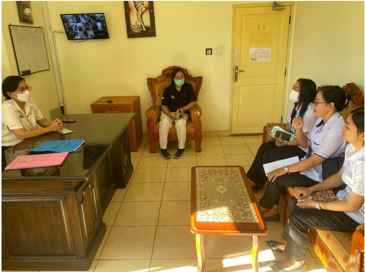
Gambar 2. Sosialisasi tarif pemeriksaan kepada pelanggan melalui brosur